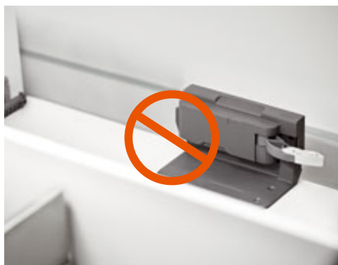
SERVO-DRIVE, elektryczne wspomaganie otwierania