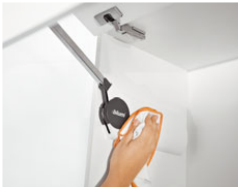
Systemy podnośników do frontów górnych