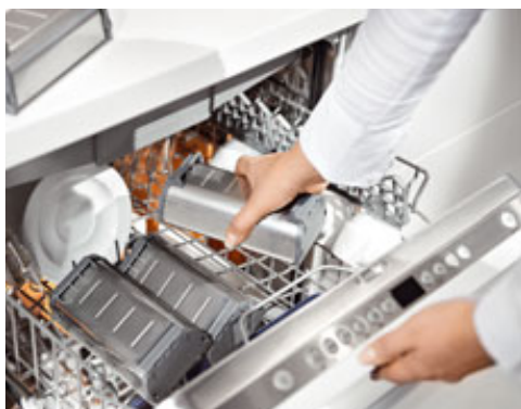
Systemy organizacji wewnętrznej