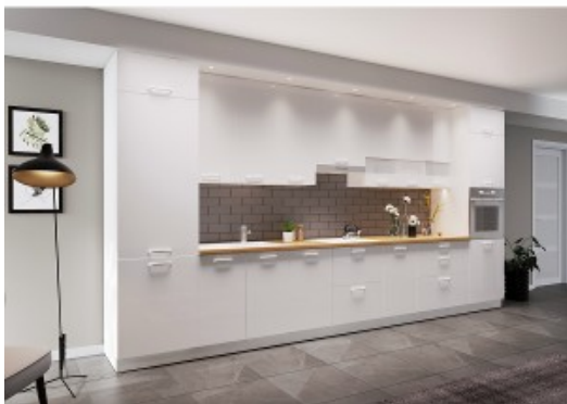
Białe uchwyty na białych frontach mebli z linii KAMmono są bardziej dyskretne, ponieważ są mniej widoczne.

- W tym sezonie bardzo modna jest miedź, która pozwala kreować efektowne aranżacje wnętrz. Ciekawie prezentuje się również w postaci uchwytów meblowych, zwłaszcza gdy zestawimy ją z frontami w ciemniejszym wybarwieniu - podpowiada projektantka.